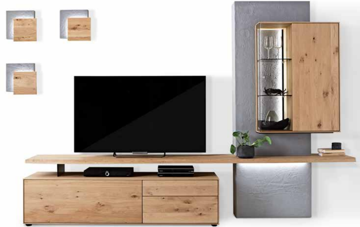
Oben: Kombinationsvorschlag Nr. 26: B 331, H 206, T 49/7 • Unten: Sideboard 5191: B 197, H 94, T 47

Durch die besondere Spachteltechnik entsteht eine edle, faszinierende Betonoptik: In dünnen Schichten wird der Beton von Hand aufgetragen, geschliffen und lackiert. Dadurch erlangt er seine einzigartige Spannung und angenehme Haptik. Im Mix mit urgewachsener Kerneiche und kantigen, massiven Holzbohlen entstehen Möbelstücke von imposanter Lebendigkeit.