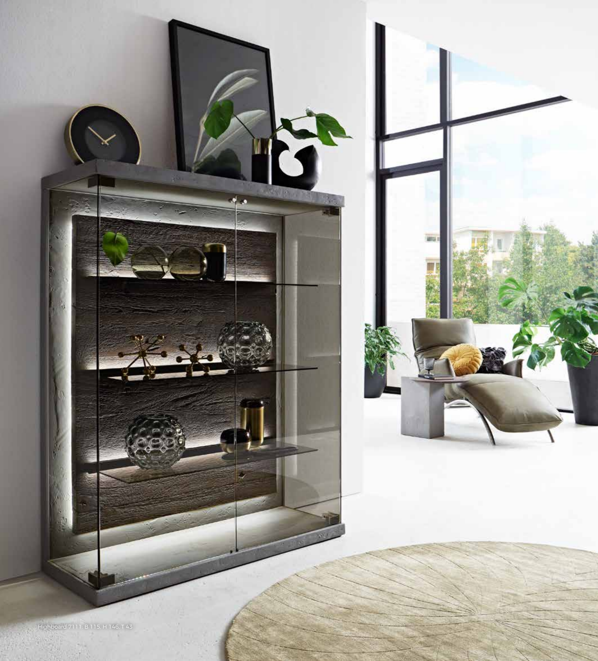
Highboard 7111: B 115, H 146, T 43