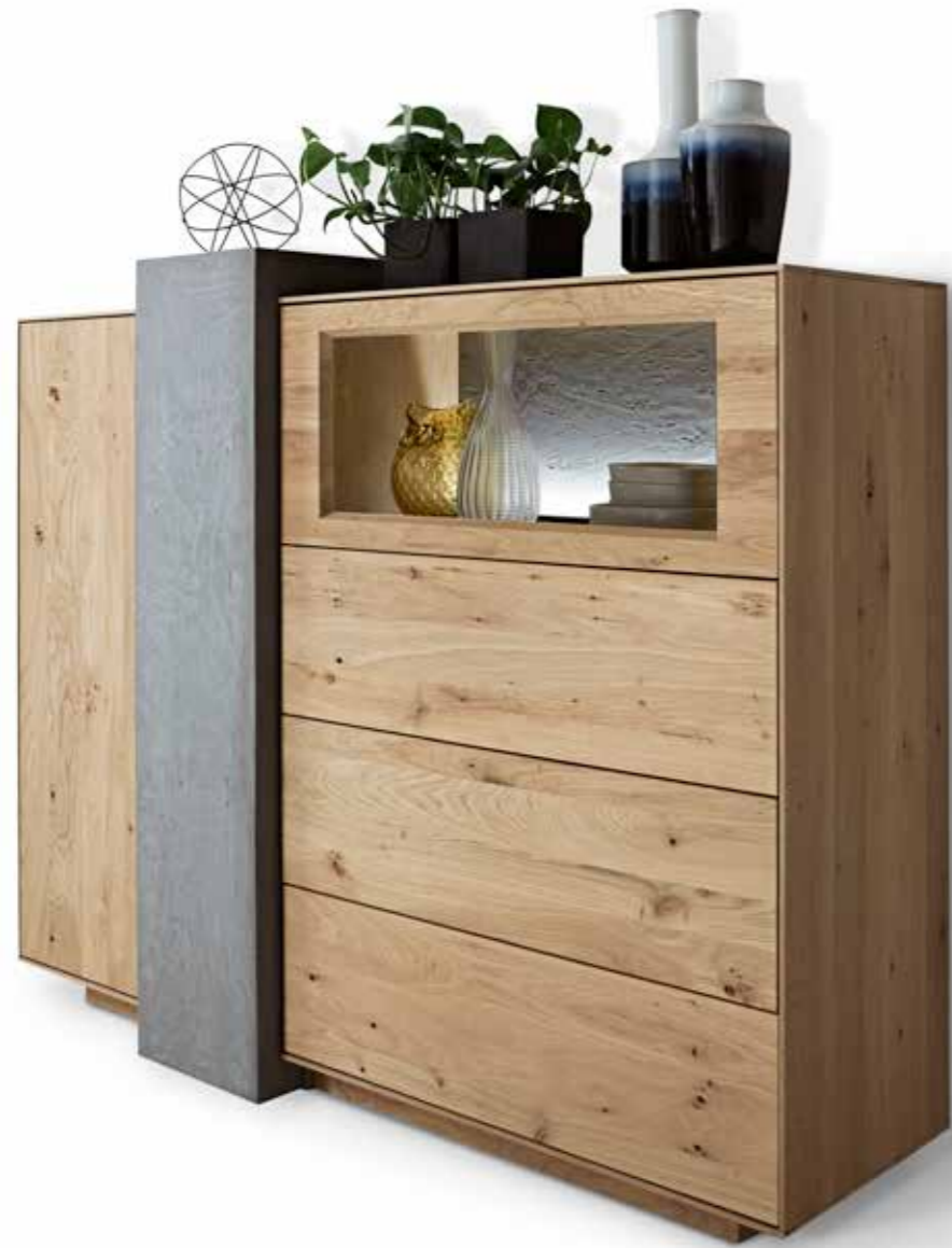
Highboard 6 181: B 157, H 130, T 47