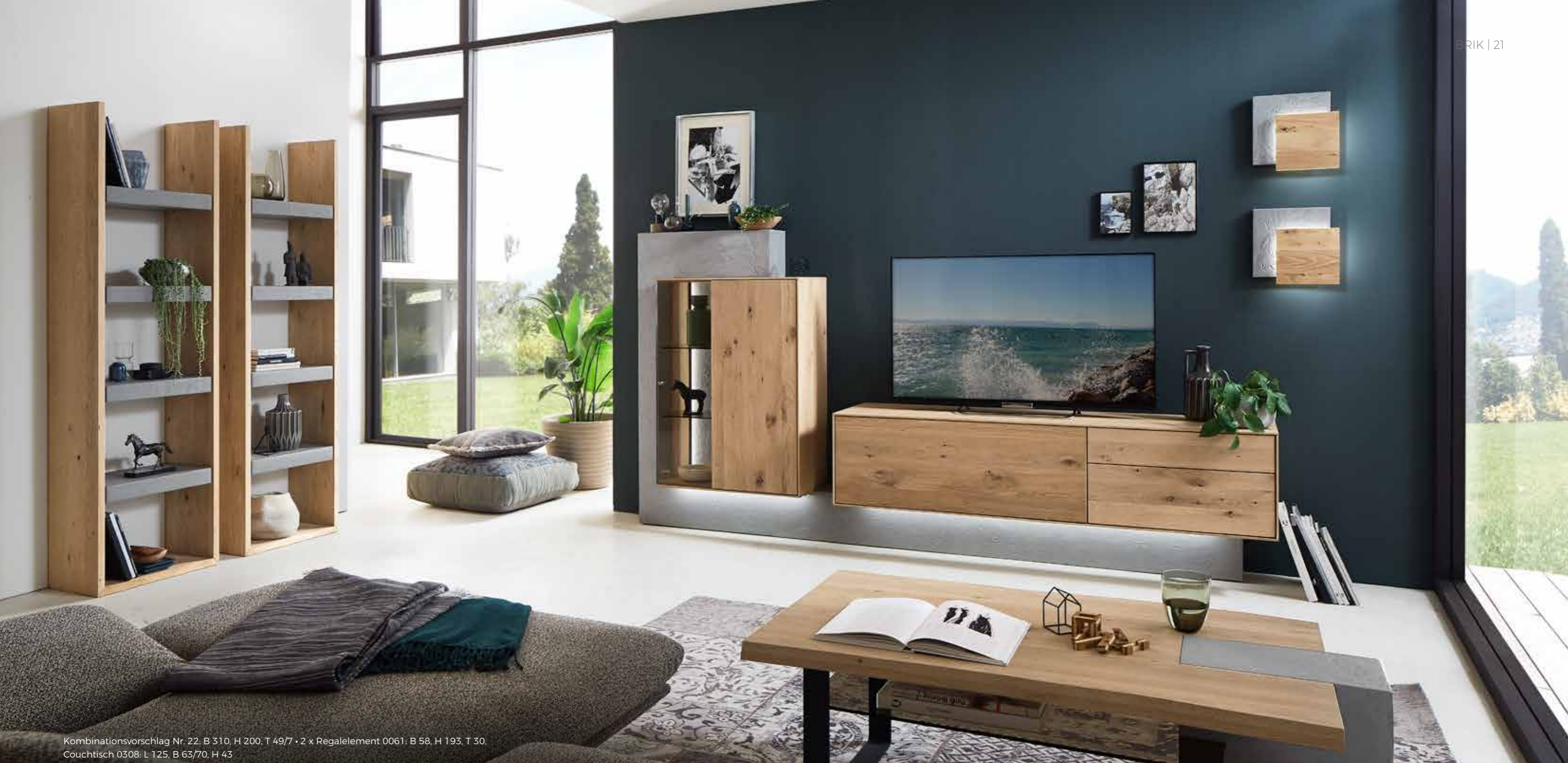
Kombinationsvorschlag Nr. 22: B 310, H 200, T 49/7 • 2 x Regalelement 0061: B 58, H 193, T 30. Couchtisch 0308: L 125, B 63/70, H 43