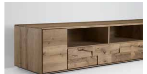
TV-Möbel ohne Sockel, Gesamthöhe 42,5 cm.

Wurde die Einrichtung früher von großen Wohnwänden bestimmt, reduzieren heute offene Räume, große Fensterflächen und Flachbild-Fernseher die möglichen Stellflächen. Deshalb haben wir bei Bent den Fokus auf modulare Bausteine gelegt, mit denen vielfältige Stauraumlösungen realisiert werden können.