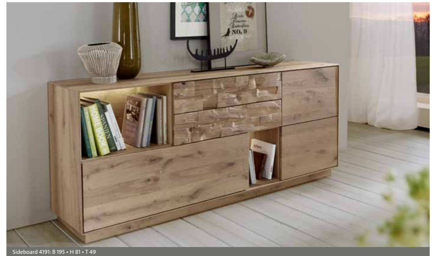
Sideboard 4191: B 195 • H 81 • T 49

Links: Die handwerklich gefertigte konische Fräsung und die feine Linienführung verleihen dem Programm seinen besonderen Charakter.