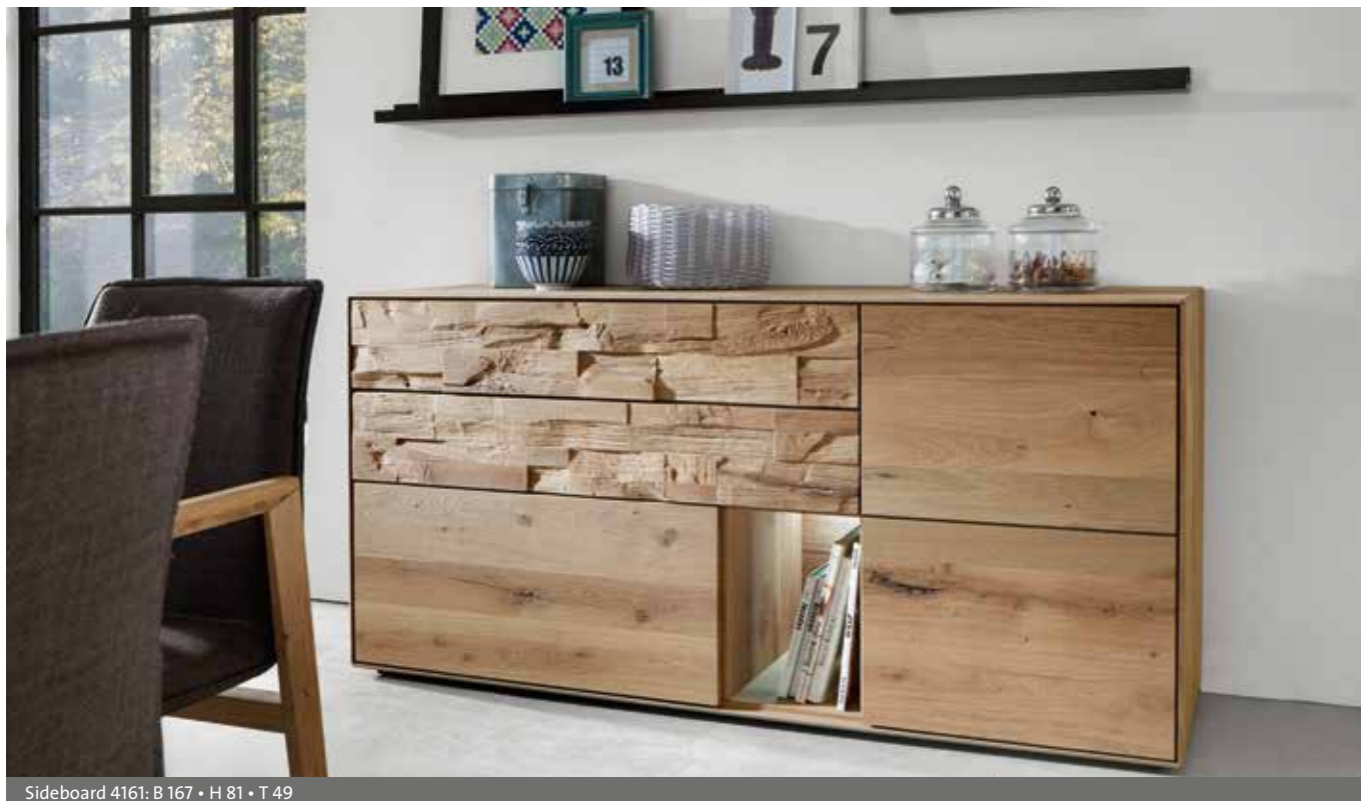
Sideboard 4161: B 167 • H 81 • T 49

Attraktive Einzeltypen runden das Programm ab. Ein echter Hingucker sind die neuen Raumteiler, die gekonnt den Speise- vom Wohnbereich trennen. Highboards und Sideboards bieten ausreichend Stauraum und in dem neuen Funktionsturm finden das Tablet oder Smartphone ihren (Lade-)platz.