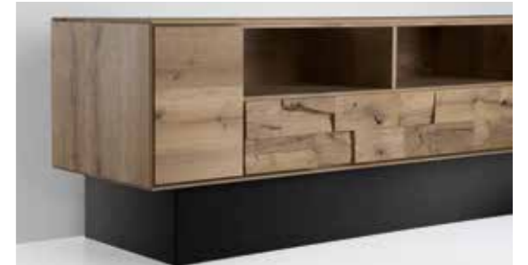
TV-Möbel mit Soundsockel, Gesamthöhe 60,5 cm.

Kombinationsvorschlag Nr. 30 S mit Soundsockel: B 321 • H 218 • T 49/28, Kombinationsvorschlag Nr. 46 S: B 204 • H 186 • T 55/28, Couchtisch 0440: L 120 • B 80 • H 45, 2x Regal 9083: B 85 • H 79 • T 28