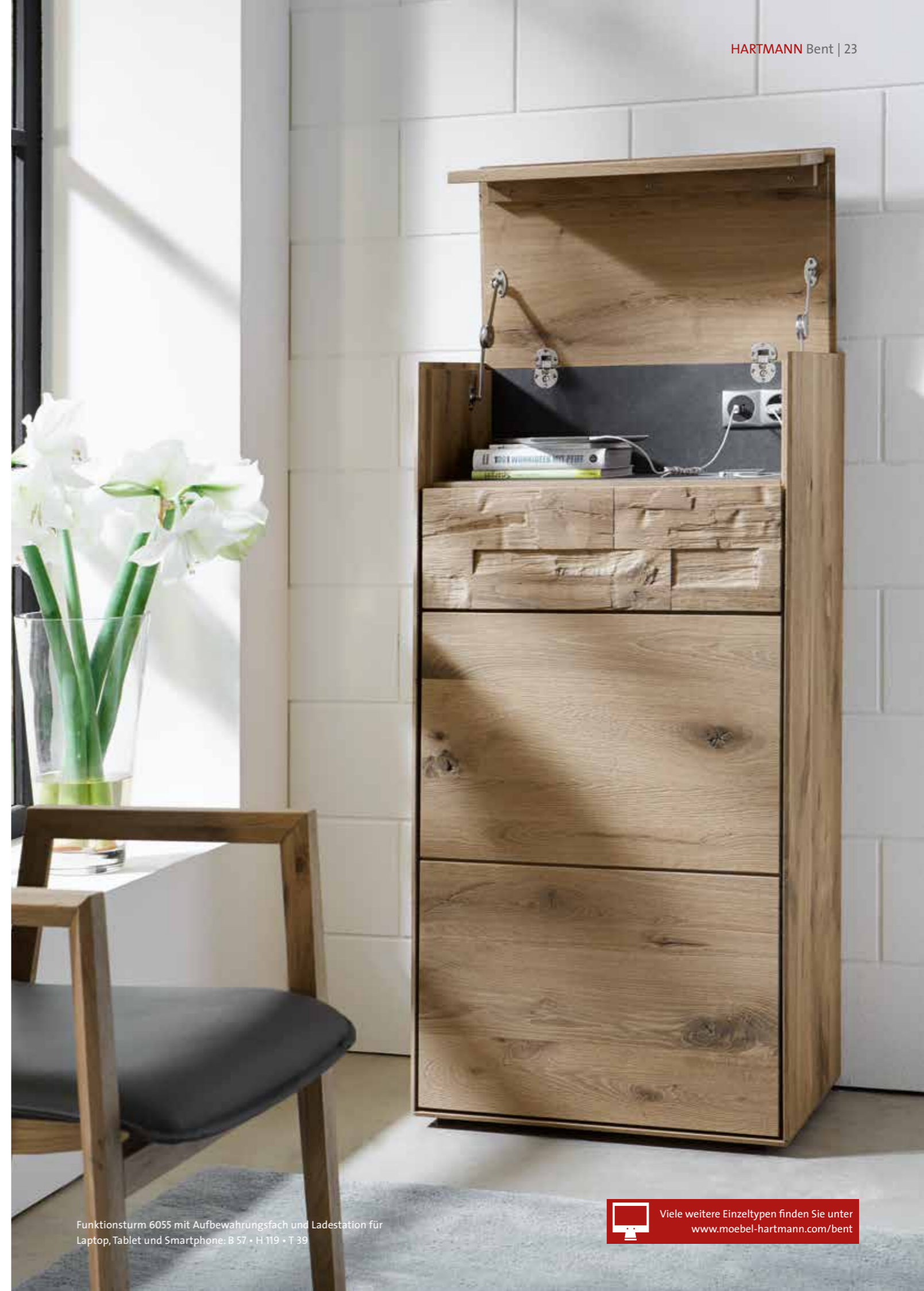
Funktionsturm 6055 mit Aufbewahrungsfach und Ladestation für Laptop, Tablet und Smartphone: B 57 • H 119 • T 39

Attractive individual characters round off the range. The new dividers are a real eye-catcher to cleverly separate the dining area from the lounge area. Highboards and sideboards provide sufficient storage space and the new functional tower offers a (charging) space for your tablet or smartphone.