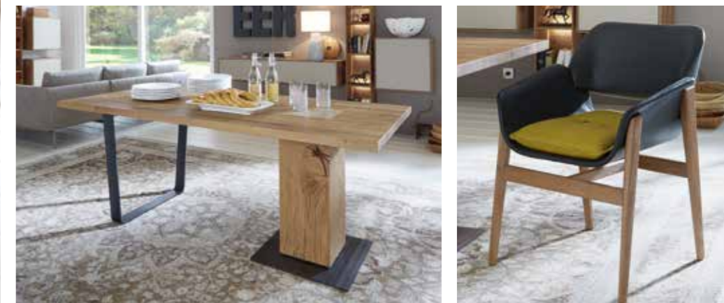
Links: Der massive Speisetisch ist ein echter Hingucker und in zwei Größen erhältlich. (entweder 190 cm oder 240 cm lang)