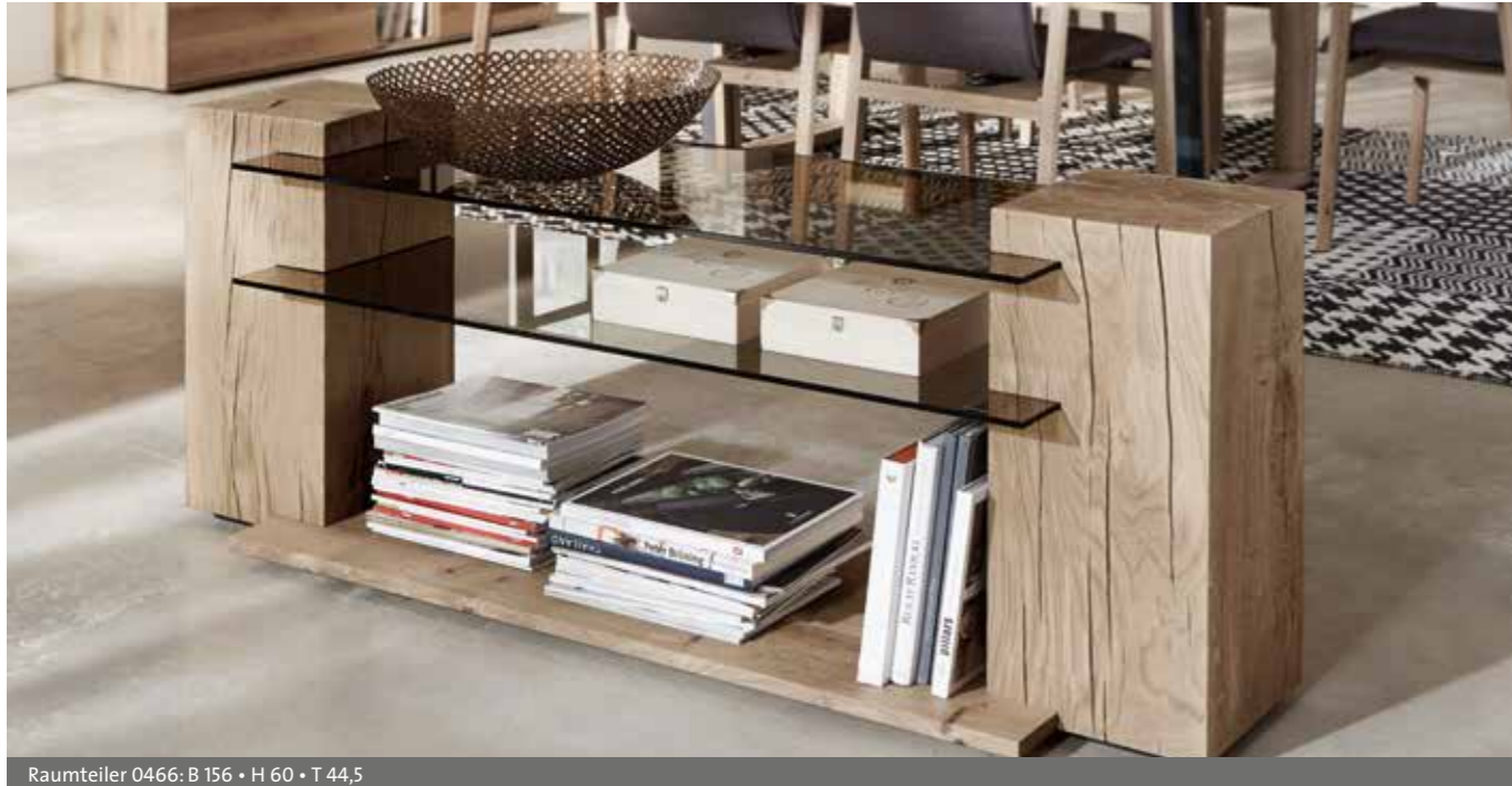
Raumteiler 0466: B 156 • H 60 • T 44,5