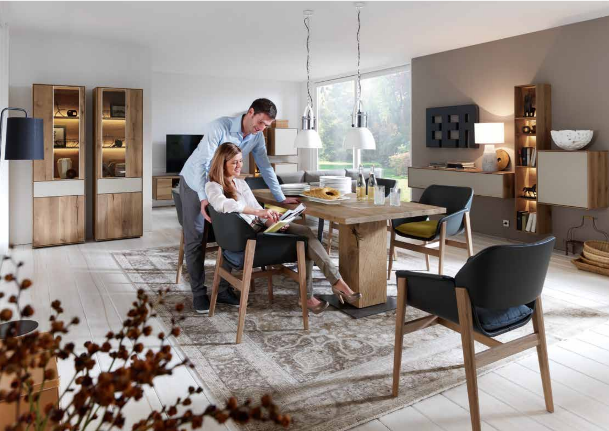
Kombinationsvorschlag Nr. 42 G: B 278 • H 193 • T 39/28, Speisetisch 0565: L 190 • B 95 • H 76, Stuhl Vida 0692: B 64 • H 84 • T 60, Standelemente 0055 und 0056: B 57 • H 202,5 • T 39, hinten: Kombinationsvorschlag Nr. 34 G: B 306 • H 193 • T 49/28

Längst hat sich der Speisebereich zum neuen Mittelpunkt der Wohnung entwickelt. Ein schöner Tisch, bequeme Stühle und elegante Beimöbel laden zum Verweilen ein. Hier trifft sich die Familie, wird gemeinsam gegessen oder einfach gemütlich beisammen gesessen.