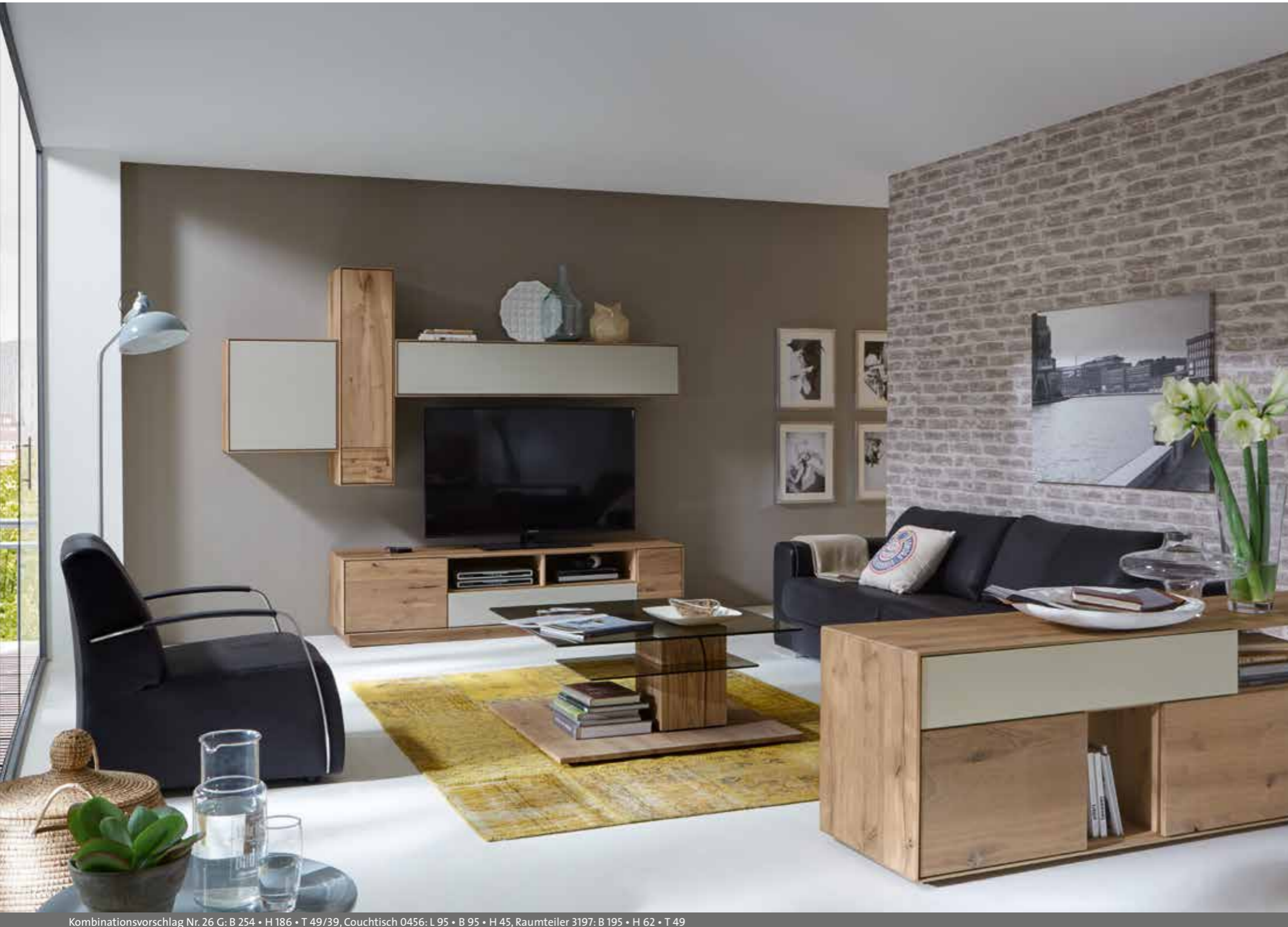
Kombinationsvorschlag Nr. 26 G: B 254 • H 186 • T 49/39, Couchtisch 0456: L 95 • B 95 • H 45, Raumteiler 3197: B 195 • H 62 • T 49