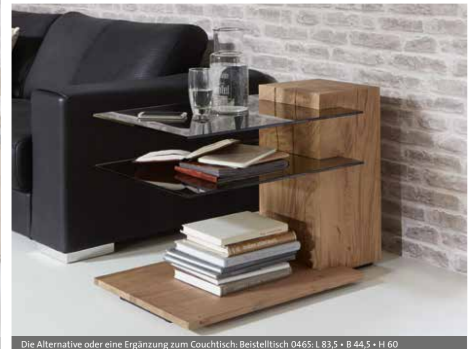
Die Alternative oder eine Ergänzung zum Couchtisch: Beistelltisch 0465: L 83,5 • B 44,5 • H 60

Bent begeistert mit einer Gestaltungsvielfalt, die keine Wünsche offen lässt. Durch die modulare Anordnung der einzelnen Elemente entstehen spannende Wohnkombinationen, die perfekt auf jede Raumsituation abgestimmt werden können. Erschaffen Sie sich ein Zuhause, so individuell wie Sie selbst.